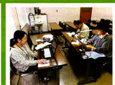
音訳テープを作成して、視覚障がい者の日常生活を支援