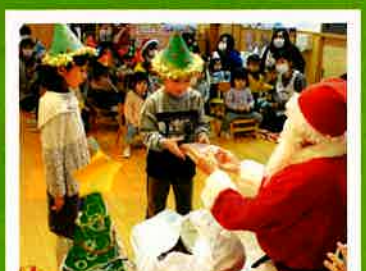
保育園等にサンタクロースを派遣して、子育て世代を応援