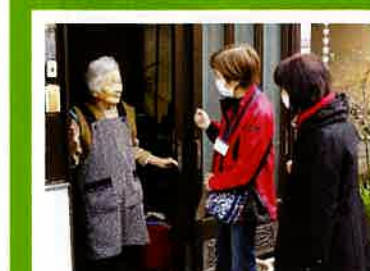
一人暮らし高齢者を訪問して、安否確認と日常生活の支援