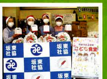
子ども食堂を通じてコロナ禍での子どもの居場所づくりと食糧支援

共同募金は、子どもの貧困をなくす取り組みや地域の防犯・災害の啓発活動など、社会課題や地域課題を解決する取り組みのほか、大規模災害が発生した際の被災地支援にも役立てられます。また、新型コロナウイルス感染症による影響が長期化する中、コロナ禍により困窮・孤立の状態にある人たちへの食糧支援や日常生活の支援も継続して行っています。県内のひとりでも多くの方に支援が届くよう、これからも活動を続けてまいります。