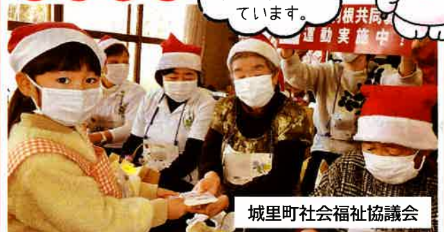
城里町社会福祉協議会

地区の公民館で高齢者と小学生の交流活動を行い、世代間交流を通じた地域のネットワークづくりや子どもの“こころ”を育む福祉教育の取り組みを支援しました。