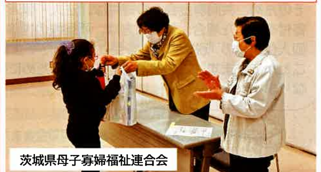
茨城県母子寡婦福祉連合会

地区の公民館で高齢者と小学生の交流活動を行い、世代間交流を通じた地域のネットワークづくりや子どもの“こころ”を育む福祉教育の取り組みを支援しました。