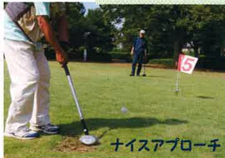
ナイスアプローチ