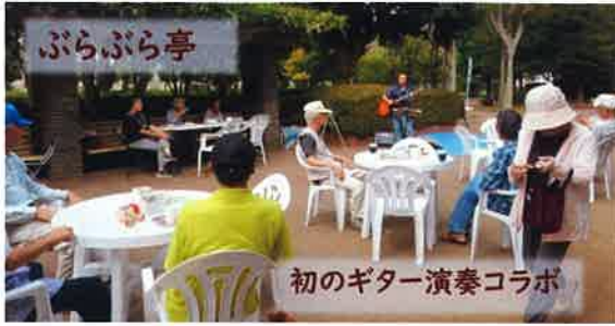
初のギター演奏コラボ

「ぶらぶら亭」の秋シリーズは9月22日から12月1日までの毎週日曜日午前10時から午後4時まで開催しております。秋シリーズでは、ギター弾き語りや野外コーラス、わくわくゲーム、ハーモニカ演奏、カントリーダンス、ビンゴ大会など様々な催し物を予定しています。詳しくは大山公園「ぶらぶら亭」ログハウスの予定表をご覧ください。（※悪天候の場合は中止となります）