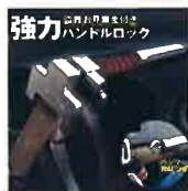
強力ハンドルロック 三千元～ 六千元程