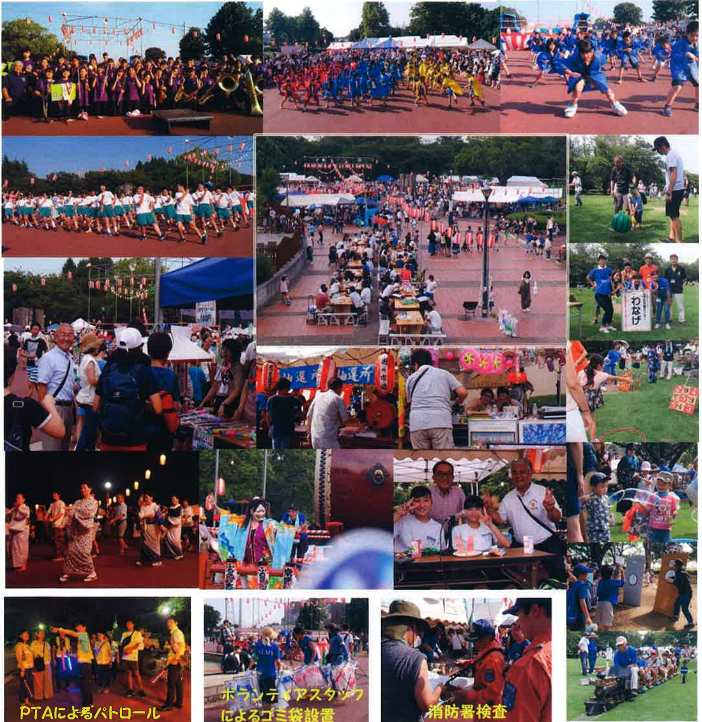
PTAによるパトロール