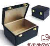
電波遮断 BOX 二千元～ 三千元程