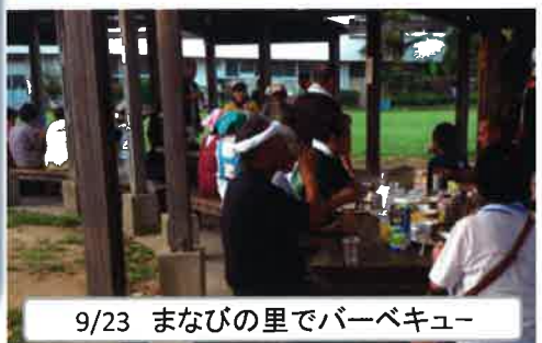
9/23 まなびの里でバーベキュー