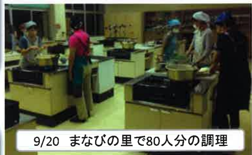
9/20 まなびの里で80人分の調理