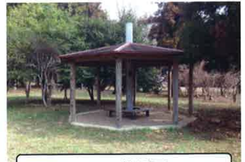
テーブル・イス4組(2組改修済)・共用倉庫新設済