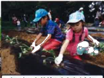
おいしいお芋ができますように