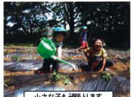
小さな子も頑張ります