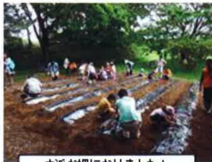
立派な畑になりました！