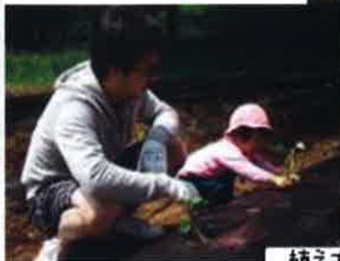
植え方はバッチリです！