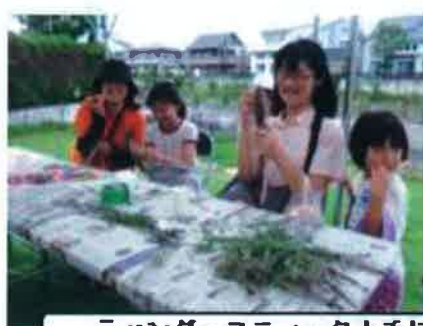
ラベンダースティック上手にできました