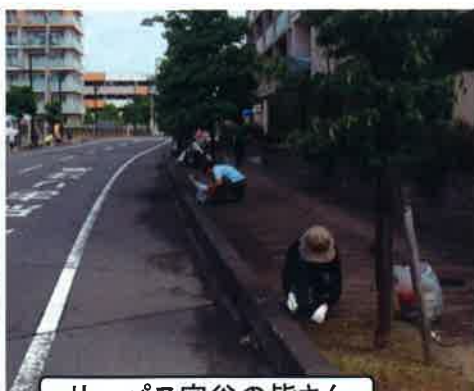
サーパス守谷の皆さん