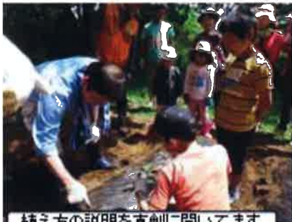
植え方の説明を真剣に聞いてます