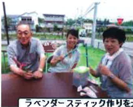
ラベンダースティック作りを大人も真剣に楽しみました