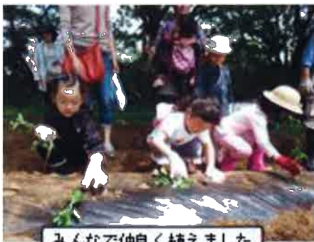
みんなで仲良く植えました