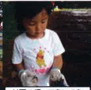
枝豆の種って青いのね