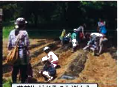
落花生がなるのも楽しみ