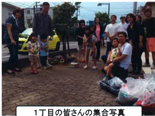
1丁目の皆さんの集合写真