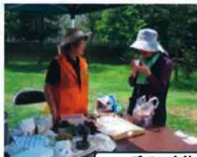
ハーブティを飲みながら会話もはずみました