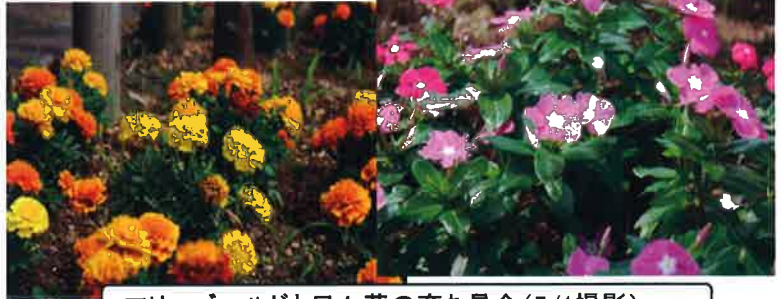
マリーゴールドと日々草の育ち具合(7/1撮影)

当日は心配した雨も朝のうちに通り過ぎ、気持ちの良いお天気となりました。300人以上の方々にご協力いただき、1000株の苗は全て植えることができました。約800mに渡って大勢の皆さんが一致協力していただいた姿は壮観でした。感謝申し上げます。