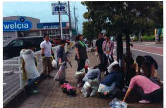
2丁目とウエルシアの皆さんが協働作業