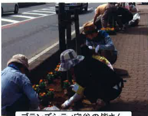
ブランズシティ守谷の皆さん