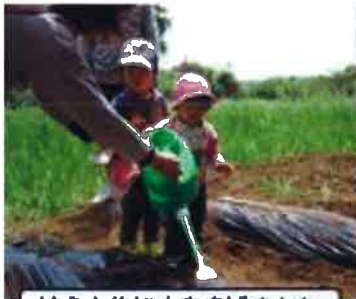
植えた後に水をあげました