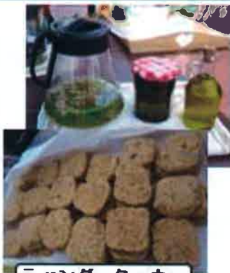
ラベンダークッキー